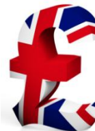
Фунты стерлингов Соединенного королевства (GBP)