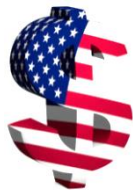
Доллар США (USD)

осуществляется покупка/продажа следующих наличных иностранных валют: