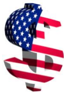
Доллар США (USD)

осуществляется покупка/продажа следующих наличных иностранных валют: